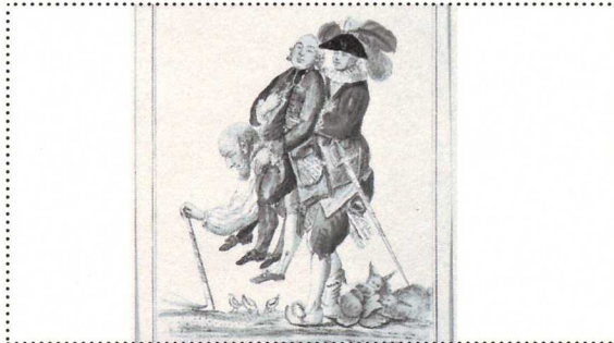
Karikatur von 1789