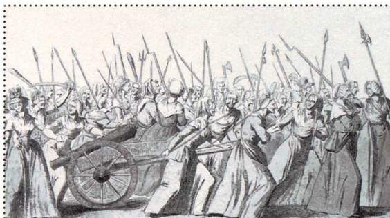
Zug der Frauen nach Versailles, 5. Oktober

Pariser Bürgerinnen und Bürger bewaffnen sich und stürmen eine Festung des Königs . Adel und Klerus verzichten auf ihre Privilegien . Die Nationalversammlung erklärt die Menschen- und Bürgerrechte .