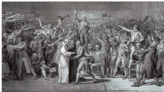
Ballhauschwur, 20. Juni

Die Bauern und Bürger sind unzufrieden. Sie wollen nicht mehr allein die Steuerlast tragen. Adel und Klerus wollen nicht auf ihre Privilegien verzichten.